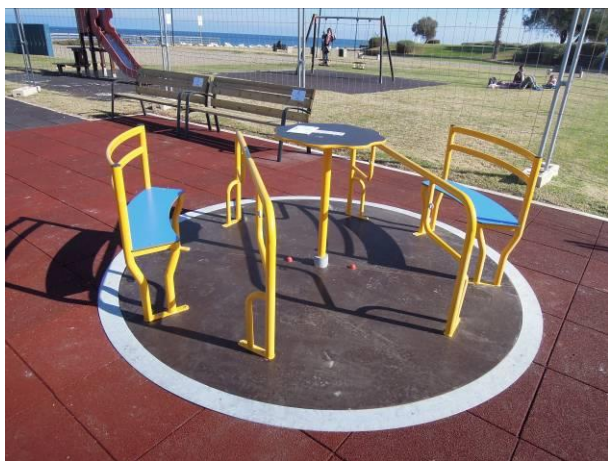
N. 1 CAROSELLO CON AREA DI SOSTA PER N. 2 CARROZZELLE