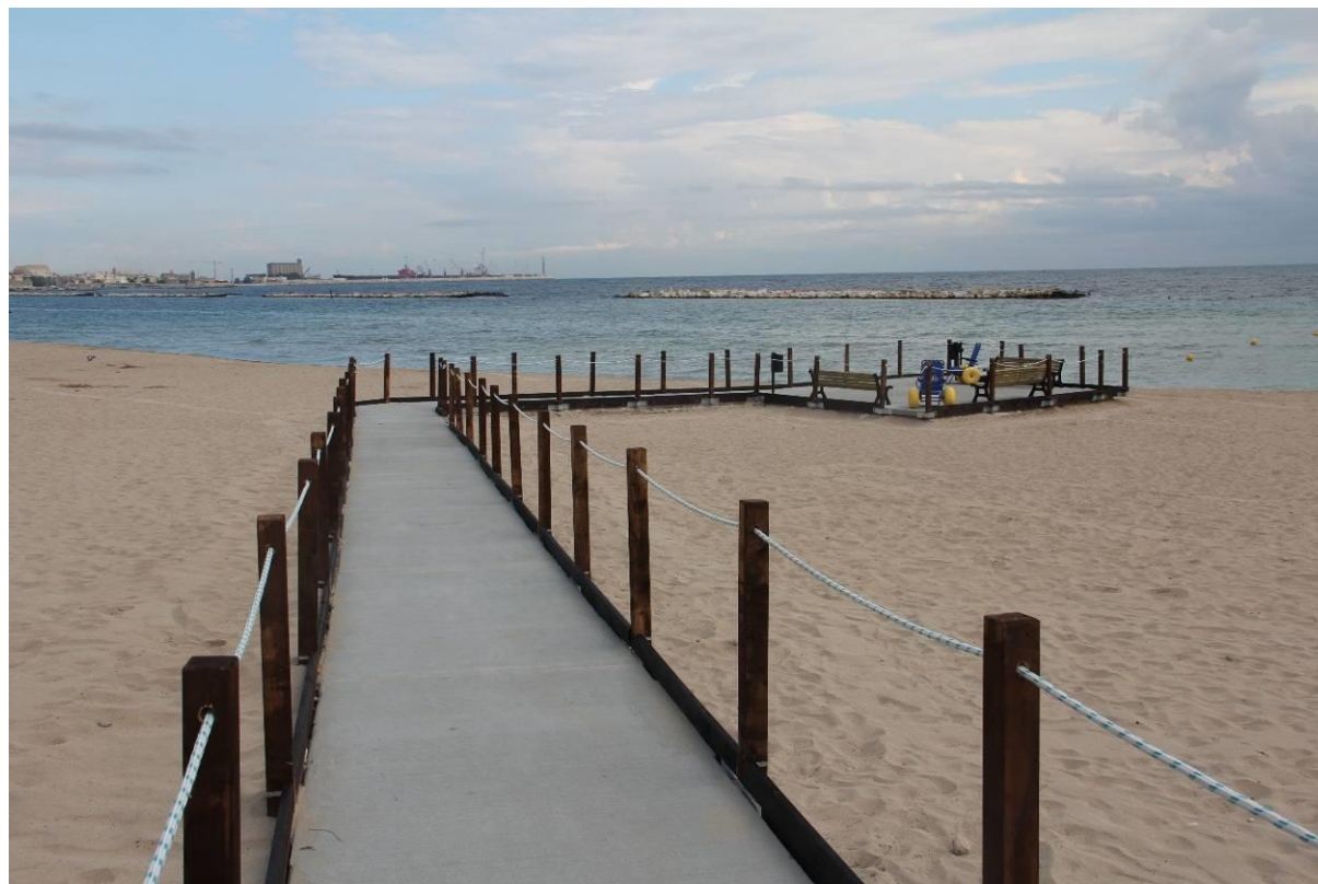
PASSERELLA PEDONALE CON PIAZZOLA