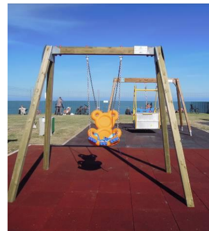
N. 1 ALTALENA CON ORSETTO