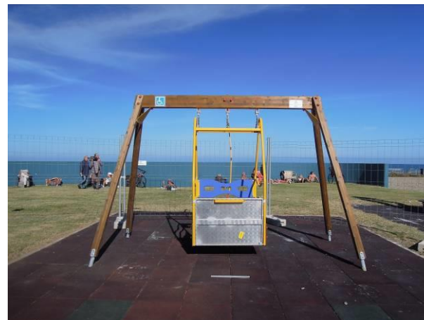
N. 1 ALTALENA PER CARROZZELLE